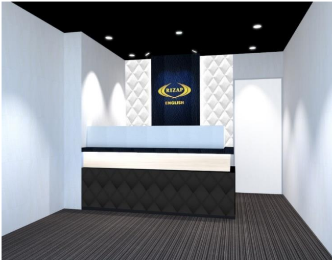
RIZAP ENGLISH 店舗数推移